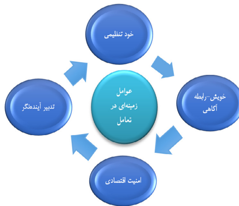
شکل ۱. مدل مفهومی مؤلفه‌های زمینه‌ای در تعامل خردورزانه همسران

بر این اساس عوامل زمینه‌ساز تعامل خردورزانه زوجین از دیدگاه قرآن کریم، نظامی منسجم متشکل از چهار مؤلفه درهم‌تنیده است. این معماری شرط لازم برای گذار از واکنش‌های هیجانی به کنش‌های مبتنی بر تأمل، انصاف و دوراندیشی در رابطه زناشویی است. تحقق تدریجی این مؤلفه‌ها در سطح فردی و رابطه‌ای، تداوم و تعالی یک ارتباط بالغانه و خردمندانه را فراهم می‌سازد.